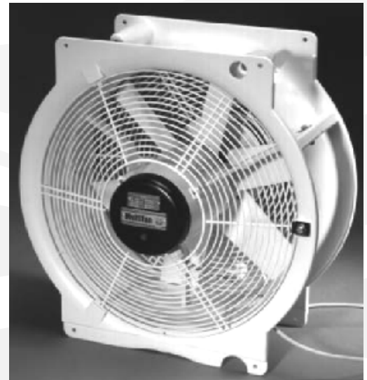
Ventilator zur Installation

(Zur optimalen Nebelverteilung wird die Anordnung der Ventilatoren im Raum von Pfalz Technik festgelegt)