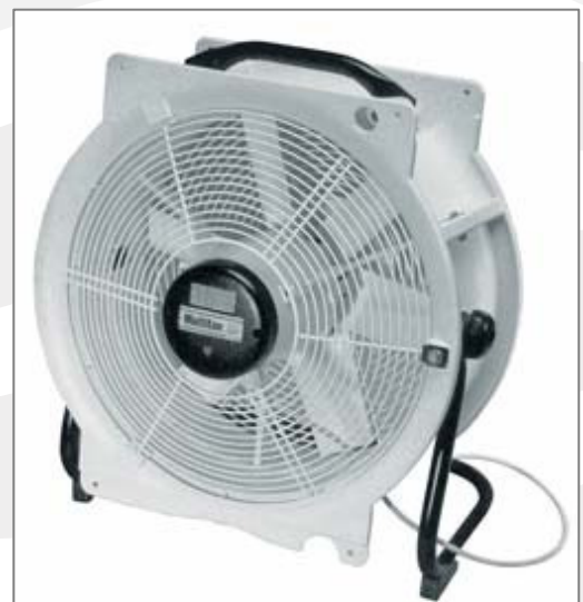
Tragbarer Ventilator mit Bügelständer und Tragegriff, 3 m Elektrokabel + Stecker 230 V